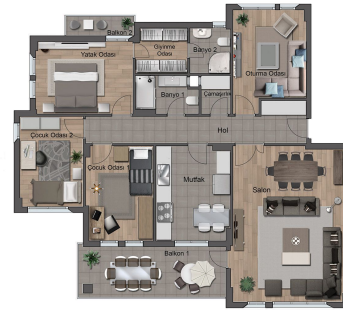
NET ALAN 156.00 m 2 A BLOK KAT PLANI