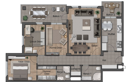
NET ALAN 130.00 m 2 B BLOK KAT PLANI