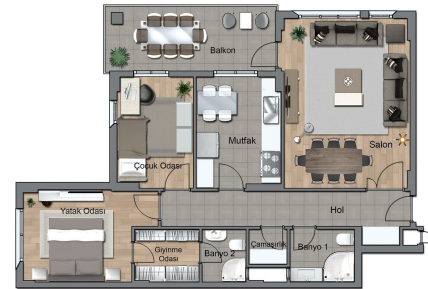
NET ALAN 105.00 m 2 C BLOK KAT PLANI